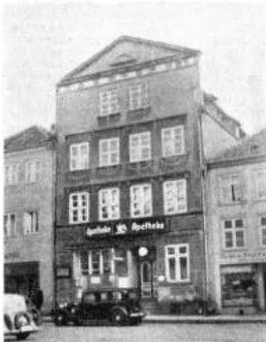
Die Adlerapothek in Rastenburg In diesem Hause wurde Arno Holz vor neunzig Jahren geboren