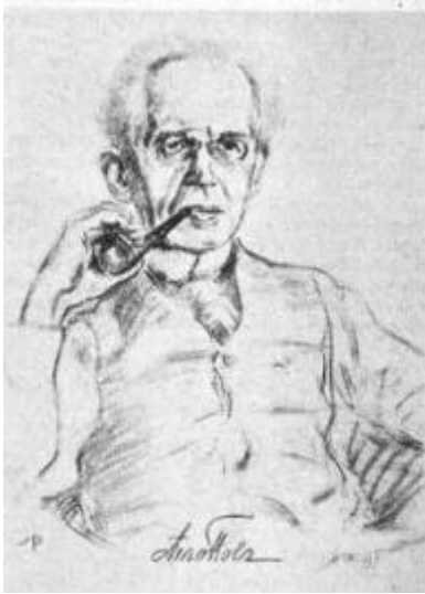
Arno Holz Zeichnung von Emil Stumpp